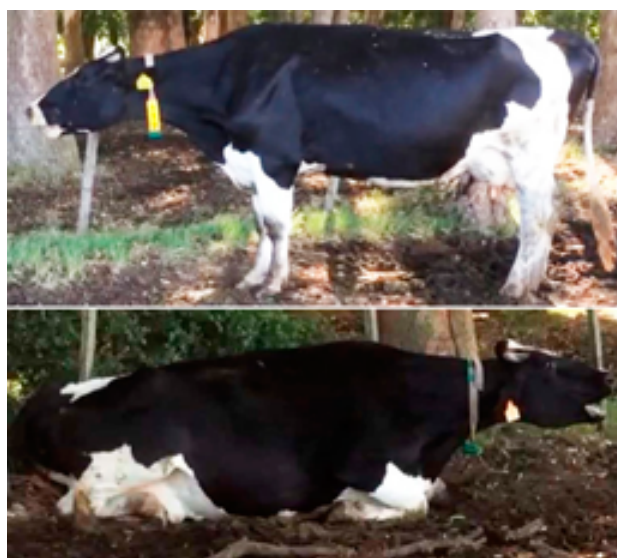
Figura 1. Ortopnea, disnea y respiración con la boca abierta en la vaca Nro. 1, minutos previos a su muerte.

Durante los exámenes patológicos no se encontraron lesiones que explicaran los signos en el tracto respiratorio. Sin embargo, en la vaca Nro. 1, se observó un absceso perihepático/peritoneal