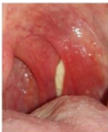
Figura 3: Placa con exudado blanquecino en faringe congestiva

En el exaen linfoganglionar presentaba múltiples adenopatías nivel cervical, yugular externo, submaxilar, axilar e inguinal; de consistencia firme elástica, móviles e indoloras a la palpación, de aproximadamente 1 cm de diámetro.