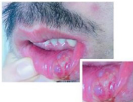
Figura 2: Cara interna de labio inferior una lesión indurada

A nivel de bucofaringe se observa en cara interna de labio inferior una lesión indurada de aproximadamente 2 cm de diámetro con superficie erosionada, cubierto de costra serosa, indoloro. Figura 2. La faringe se presentaba congestiva con exudado blanquecino en forma de placas. Figura 3.