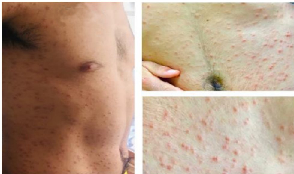
Figura 1: Lesiones maculopápulas eritematosas de distribución universal.

A nivel de bucofaringe se observa en cara interna de labio inferior una lesión indurada de aproximadamente 2 cm de diámetro con superficie erosionada, cubierto de costra serosa, indoloro. Figura 2. La faringe se presentaba congestiva con exudado blanquecino en forma de placas. Figura 3.