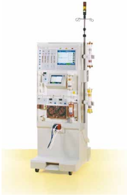
Figura 1: Prometheus® Fresenius Medical Care