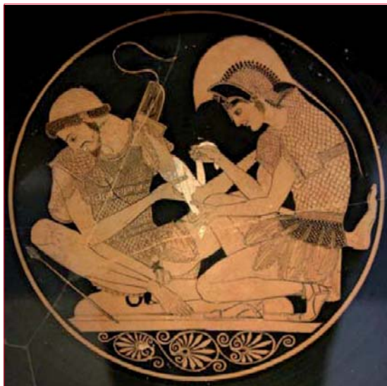
Figura 1. Tekné y medeos: cerámica griega que muestra a Aquiles curando una herida de Patroclo y proporcionándole cuidado.

el cual, a través de la exposición racional de los discursos, se llega a lo verdadero. Este viaje a la etimología de la palabra diálogo tiene una implicancia práctica ineludible: quiere decir que el origen de la palabra parece validar la interpretación moderna de la relación médico-paciente como un proceso comunicacional y decisorio esencialmente colaborativo, negociado y dialógico.