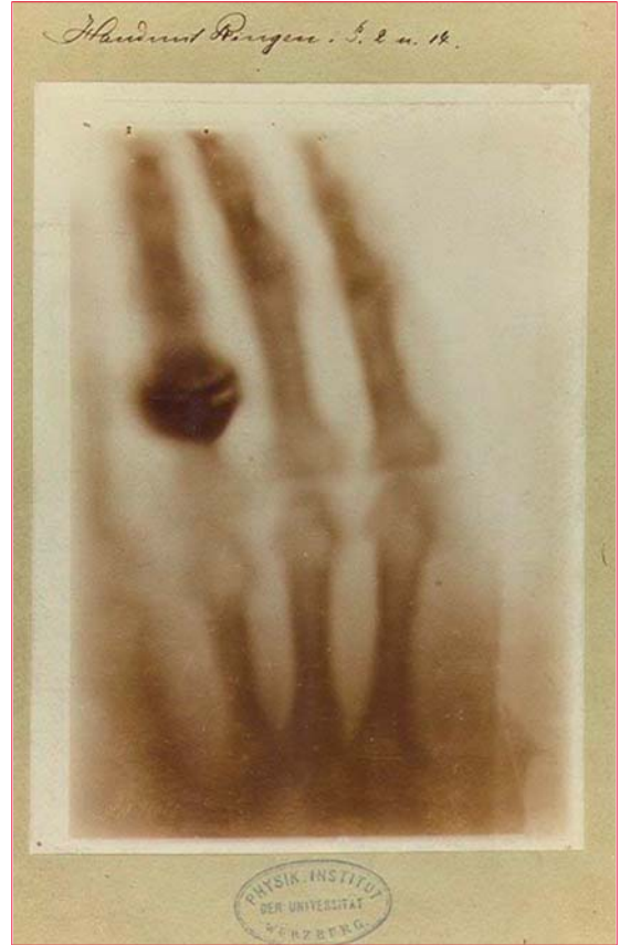
Figura 2. La mano de la esposa del físico alemán Wilhelm Röntgen (1845-1923), quien descubriera los rayos X en 1895. Recibió el premio Nobel de Física en 1901. Se considera la primera radiografía de la historia.

En próximos artículos (aunque de forma no lineal) iremos presentando breves historias relativas a esta apasionante historia: la historia del cuerpo.