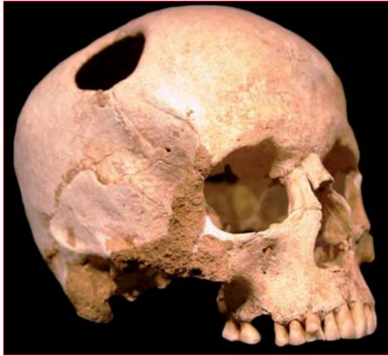
Figura 1. Cráneo trepanado, período neolítico. El perímetro del agujero en el cráneo está rodeado de nuevo tejido óseo, lo que indica que el paciente sobrevivió a la operación. Museo de Historia Natural de Lausanne. Tomado de la revista Alma.

una vez tomada la radiografía ya no fue necesario tener el cuerpo presente para estudiarlo (figura 2).