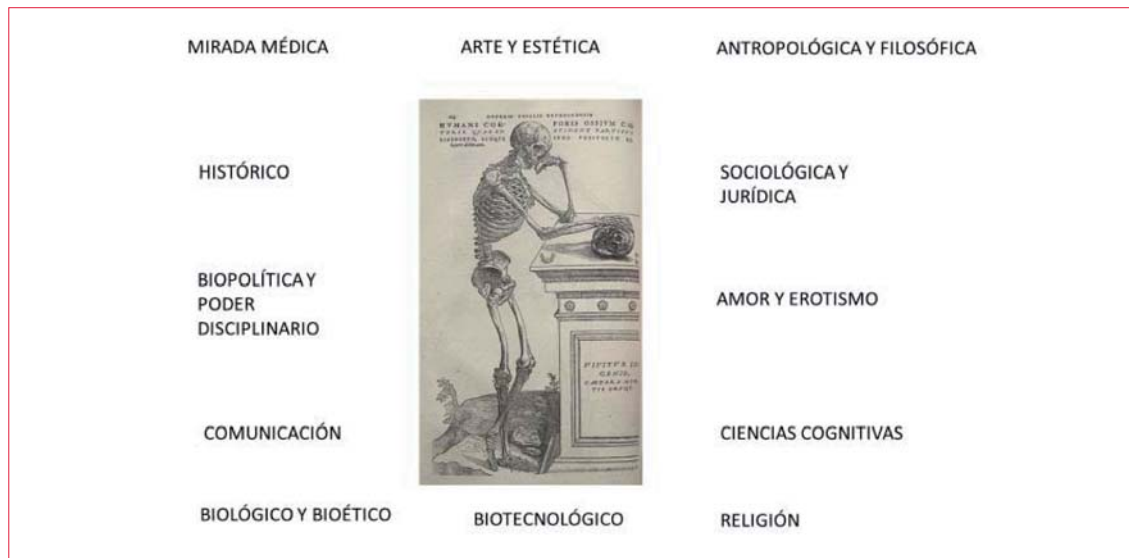
Cuadro 1. El cuerpo y sus abordajes

India medieval y a los del antiguo Egipto. La hambruna, la peste y la guerra coparon siempre los primeros puestos de la lista. Generación tras generación, los seres humanos rezaron a todos los dioses, ángeles y santos, e inventaron innumerables utensilios, instituciones y sistemas sociales... pero siguieron muriendo por millones a causa del hambre, las epidemias y la violencia. Muchos pensadores y profetas concluyeron que la hambruna, la peste y la guerra debían de ser una parte integral del plan cósmico de Dios o de nuestra naturaleza imperfecta, y que nada excepto el final de los tiempos nos libraría de ellas 3 .