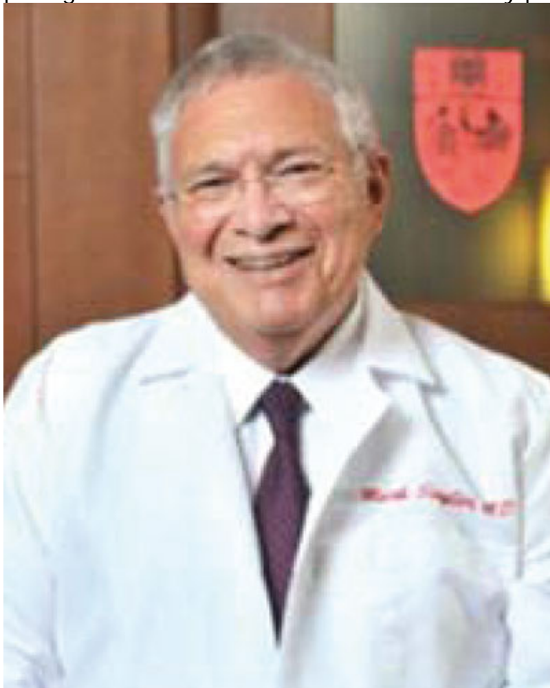
Marck Siegler (1941). Internista y bioeticista estadounidense.

No obstante lo anterior, los conceptos medulares de estos tres autores hasta aquí mencionados (Couceiro, Laín Entralgo y Siegler), entre otros, dibujan un horizonte hacia el cual debe caminar la medicina moderna si pretende recuperar la confianza mutua y el encuentro fértil de estos dos protagonistas centrales de la clínica: médico y paciente.