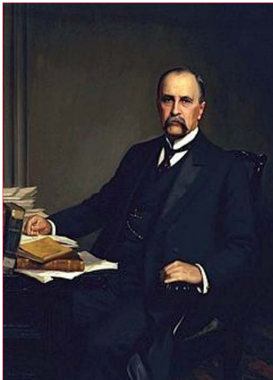
William Osler (1849-1919)

Si todo cambia a ritmo tan rápido, si todo se transforma en torbellino, ¿cómo se mantienen las identidades? ¿Cómo las cosas, en este caso la profesión médica, se distinguen y se identifican entre otras actividades? Los conocimientos y las técnicas varían, las personas