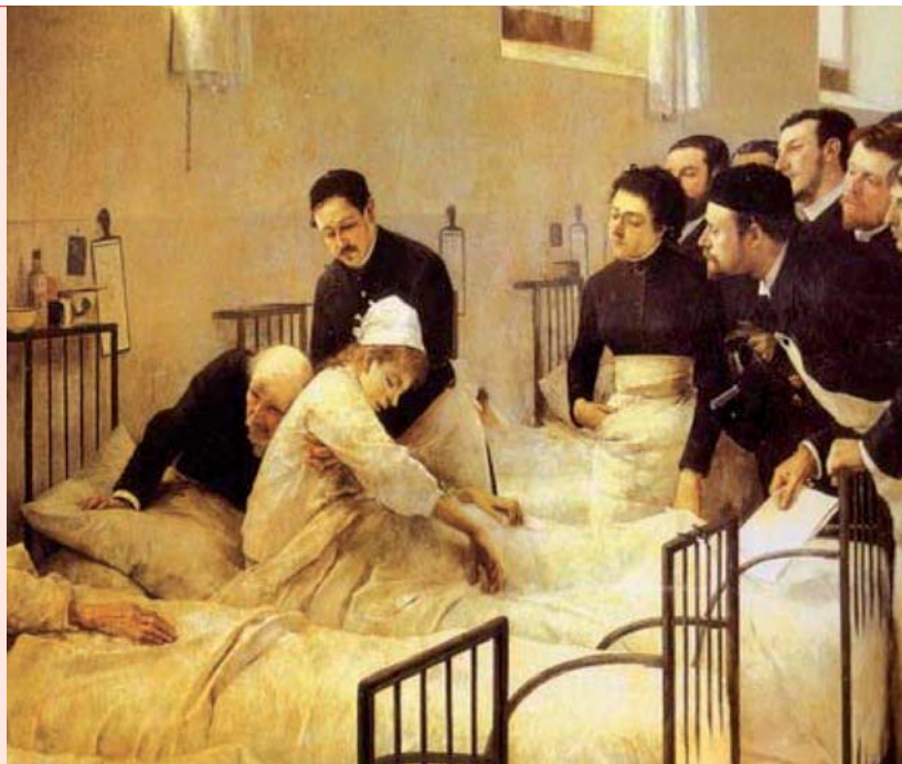
Luis Jiménez Aranda. Visita de sala (1889). Óleo sobre tela, 290 por 445 cm. Museo del Prado, Madrid