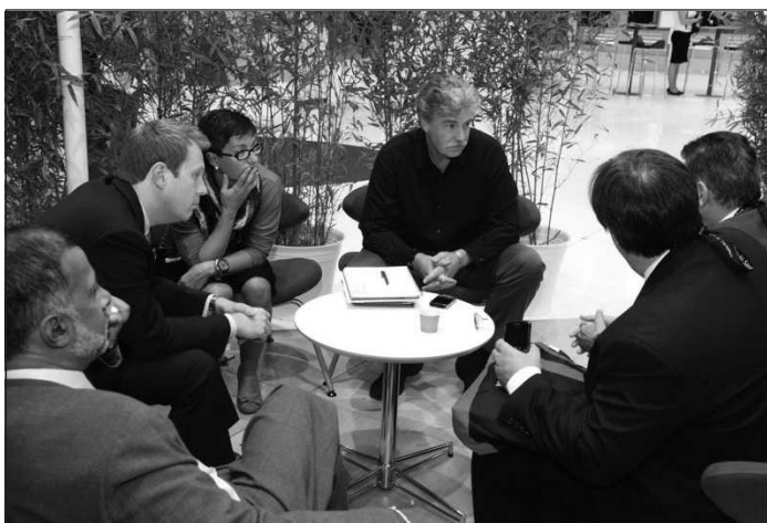
Figura 2. Mesa redonda en congreso ESC