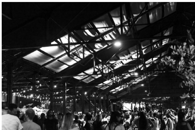
Figura 8. Inauguración de la plaza de las Pioneras, 7 de marzo de 2020, Arroyo Seco, Montevideo.