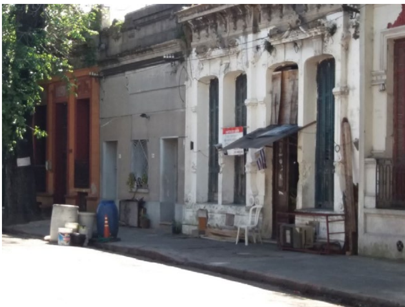
Figura 1. Lavadero de automóviles clandestino operando en la fachada de una antigua casa a patio. Fuente: Autor, Arroyo Seco, Montevideo, 2017.