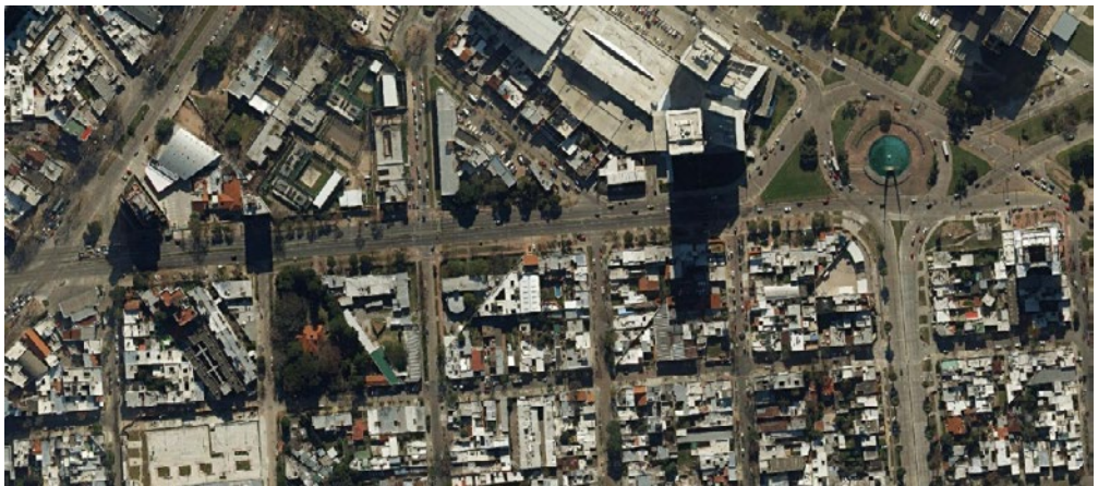
Figura 4. Nuevo Centro, donde quiebra el Bulevar Artigas (límite externo formal del segundo ensanche histórico), Jacinto Vera, Montevideo.

De todas formas Barrios Pintos (1971, 29) indica, junto a los datos anteriores, que por 1912 contaba con pocas casas y una población de 150 habitantes. Ocurre que fue ocupado por ranchos de lata –al decir del poeta local Líber Falco–, residencia de los obreros que erigieron a su vez los barrios Reus del Norte y del Sur (Schiavone, 2015). Recordemos que Francisco Piria integraba aquellos emprendimientos llevados a cabo unos años antes (de 1888 a 1892), promovidos por Emilio Reus otra de las máximas figuras de los desarrollistas hacedores de la expansión montevidéana. O sea: Piria ges-