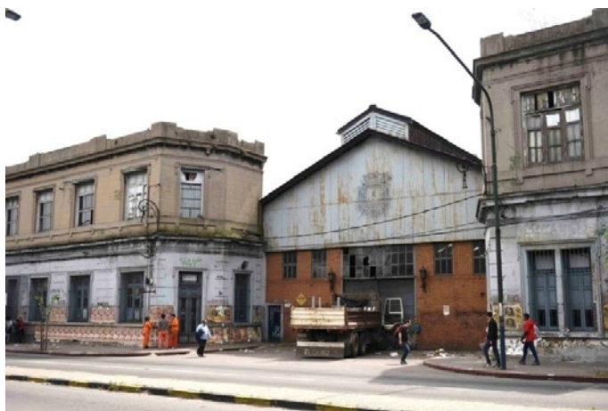
Figura 7. Antiguas instalaciones municipales antes de la reforma que en 2020 diera lugar a la plaza de las Pioneras, incluyendo sus casas, Arroyo Seco, Montevideo.

sociales, en este caso en manos de colectivos feministas que tienen sus sedes en las áreas cercanas. En un momento donde las reivindicaciones por la equidad de género se han vuelto un asunto por demás trascendente, involucrando hábitos profundamente arraigados en la cultura e idiosincrasia de la ciudad, con este proyecto y otros afines se está dando lugar a una perspectiva sobre el urbanismo y el habitar centrada en los cuidados y el sostenimiento de la vida, otra sensibilidad y subjetividad más en general que interpela al patriarcado enraizado en nuestra civilización (Col·lectiu Punt 6, 2019; Alvarez Pedrosian, 2020; IM, 2020).