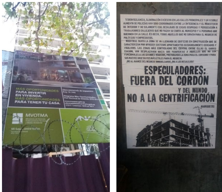
Figuras 5 y 6. Edificio en obra bajo la Ley 18.795 y carteles de colectivos autodenominados anarquistas contra la gentrificación. Fuente: Autor, Cordón, Montevideo, 2017.