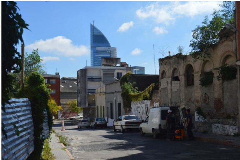
Figura 2. Estados de la materia, paisajes urbanos, formas del capital. Fuente: Pedro Cayota, Aguada, Montevideo, 2016.