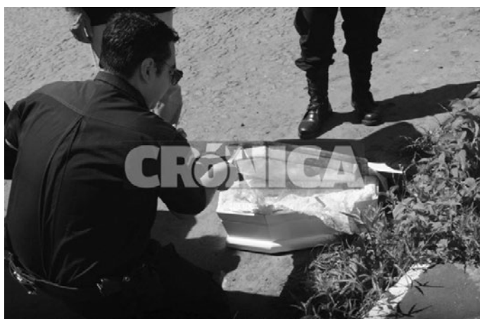
IMAGEN Nº2. ATAÚD DE ANGELITO HALLADO EN LAS CALLES DE FERNANDO DE LA MORA. PARAGUAY. 21 DE OCTUBRE DE 2013. PARAGUAY.

Reporteros del Diario Crónica nos proporcionaron las imágenes que permiten ilustrar esta particularidad. Podemos observar el diminuto ataúd de color blanco, con la blanda interna.