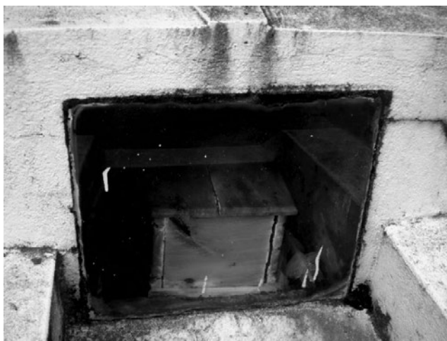
IMAGEN N°1. TUMBA Y ATAÚD DE ANGELITO. TUMBA SOBRE LA TIERRA CON VISOR DE VIDRIO. CEMENTERIO MUNICIPAL DE ITUZAINGÓ, CORRIENTES. ARGENTINA. 2012.

En situaciones de pobreza e imposibilidad de acceso a cobertura social y ante la defunción del niño es frecuente, si se trata de un angelito recién nacido, que la familia confeccione un pequeño cajoncito de madera y lo pinte de colores claros. Por su relevancia significativa exhibimos el ejemplo de un precario cajoncito de madera observado en la tumba de este angelito.