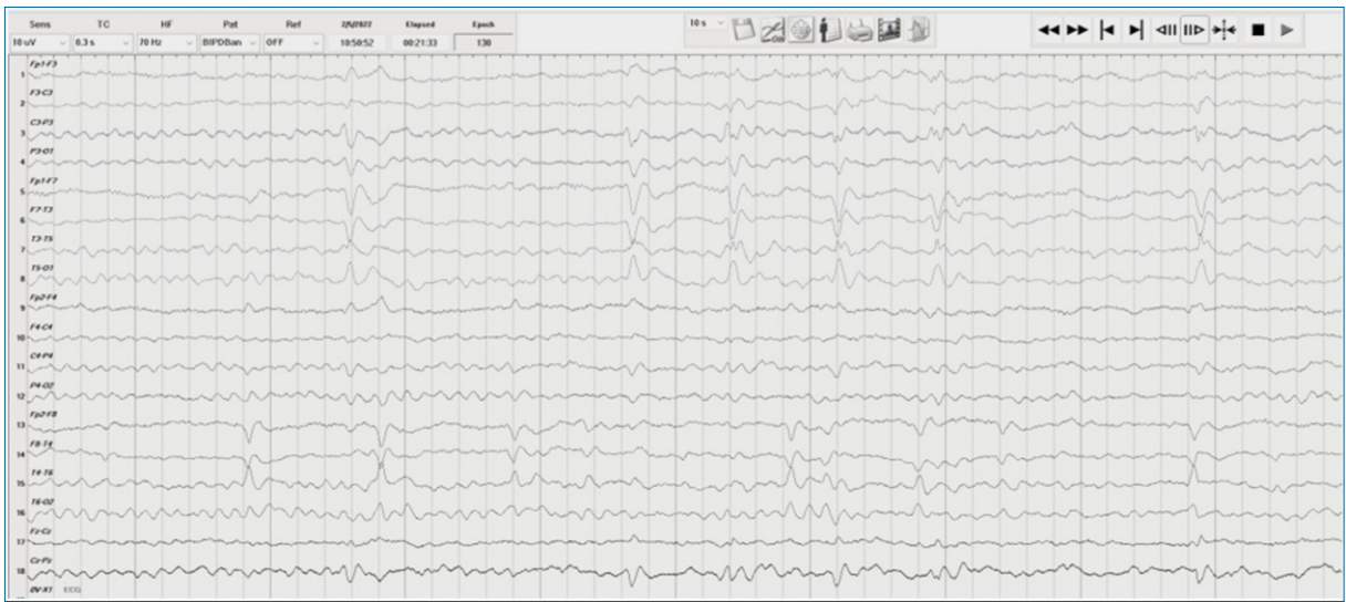
Figura 3. EEG en vigilia. Época de 10 segundos. Transitorio patológico: actividad epileptiforme focal e interictal en hemisferio izquierdo y en hemisferio derecho. Montaje bipolar. Registros del autor.