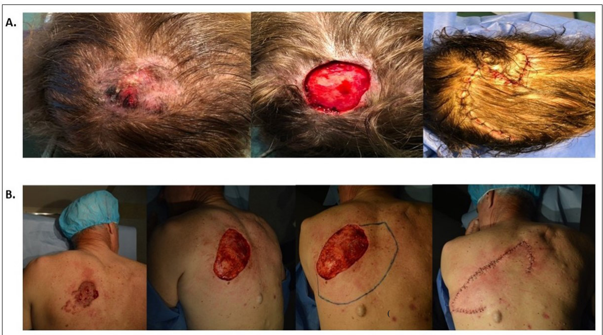
Figura 4. A. Colgajo O-Z. B. Colgajo de Keystone

piel clara (5) , con el 96,3% de los operados con CMM con fototipos de Fitzpatrick bajos (II y III), siendo el más frecuente el fototipo III.