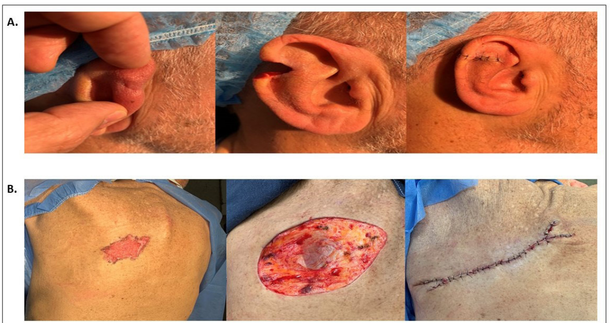
Figura 3. A. Cierre simple en cuña. B. M-plastia doble