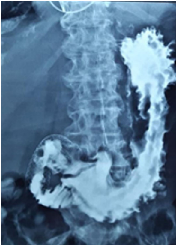
Figura 4. Esofagogastroduodeno doble contraste de control. Se observa pasaje de contraste a duodeno. PMA normoposicionada.

Su utilización ha venido en ascenso en los últimos años. No contamos en Uruguay con experiencia registrada en cuanto a la paliación endoscópica en este tipo de pacientes debido, en parte, a la ausencia de endoscopistas con experiencia en la técnica en todos los centros, además de ser un dispositivo de alto costo que no forma parte de las prestaciones sanitarias del Plan Integral de Atención en Salud (PIAS).