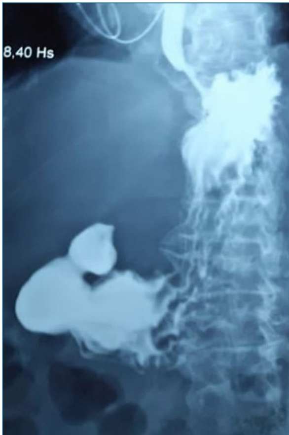
Figura 2. Esófagogastroduodeno doble contraste: se observa ausencia de pasaje de contraste a duodeno.

mediante técnica combinada con fluoroscopia, sin incidentes (figura 3).