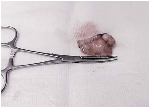
Figura 1. Pieza de apendicectomía.