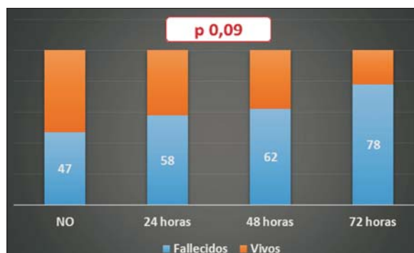
Figura 3. Mortalidad (%) en UCI según presencia y tiempo de instalación de criterios de activación

Durante el período de estudio, el 13% de los pacientes ingresados a UCI procedían de sala general teniendo como causa de ingreso un deterioro de su situación clínica. El motivo de ingreso fue en su mayoría insuficiencia respiratoria y sepsis (22% y 20,3%), seguido por causas neurológicas y shock principalmente (figura 1). Estos pacientes presentaban una estadía hospitalaria previo al ingreso a UCI prolongada, con una media \pm