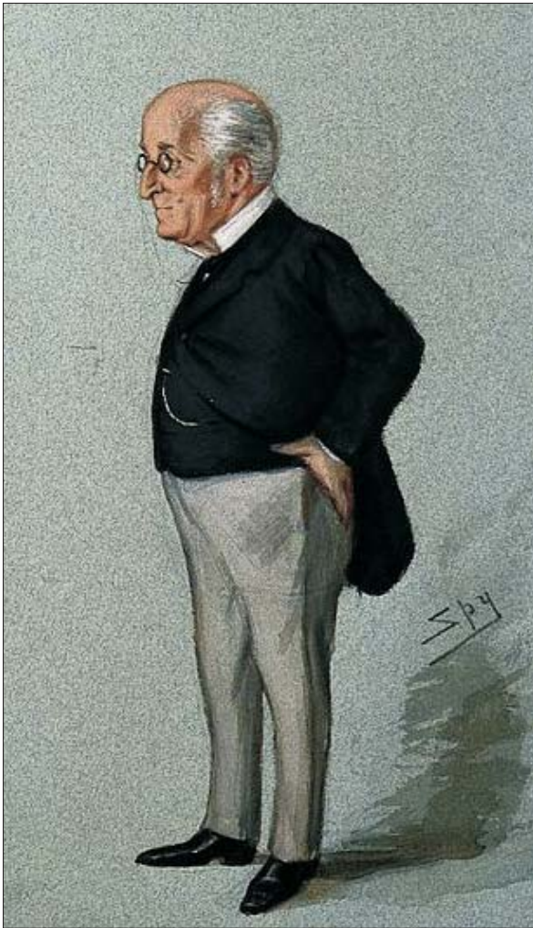
Figura 1. James Manby Gully. Hidroterapeuta británico especialista en agua helada. Poseía un establecimiento en la zona de Malvern al que Darwin acudió en numerosas oportunidades.

clusión, sin deberes sociales y sin dar conferencias. “La enfermedad me salvó de la distracción y del goce de la sociedad” (2) .