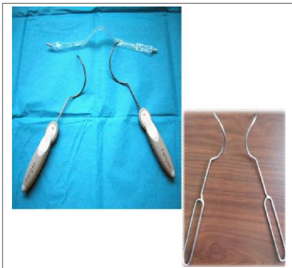
Figura 3. Agujas helicoidales para el pasaje transobturatriz posterior.