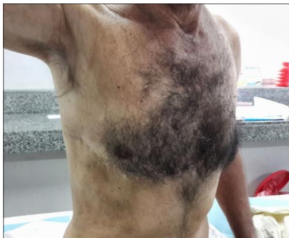
Figura 5. Imagen del paciente al año de la cirugía, se evidencia el buen resultado mecánico y cosmético, sin recidivas locales.