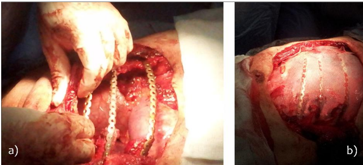
Figura 3. a) La resección se completó y se colocan las prótesis de titanio al sector de parrilla costal remanente. b) La misma se cubre con una malla de polipropileno a tensión para mantener la forma de la pared torácica, evitando la herniación del pulmón subyacente.

pleomorfismo, sin mitosis ni necrosis, que corresponde a un condrosarcoma de bajo grado de malignidad.