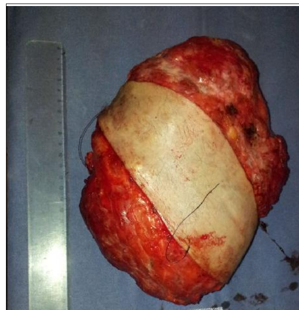
Figura 4. Pieza de anatomía patológica de 19 por 18 por 10,5 cm, con un área total de 268 cm 2 , cuyo resultado definitivo correspondió a sarcoma de bajo grado.

De las series más grandes de resección de tumores de pared torácica, Weyant y colaboradores (3) reportan una mortalidad de 3,8% y hasta un 3% de falla respiratoria,