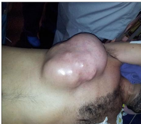
Figura 1. Paciente en decúbito lateral izquierdo donde se muestra la voluminosa tumoración de la pared torácica.