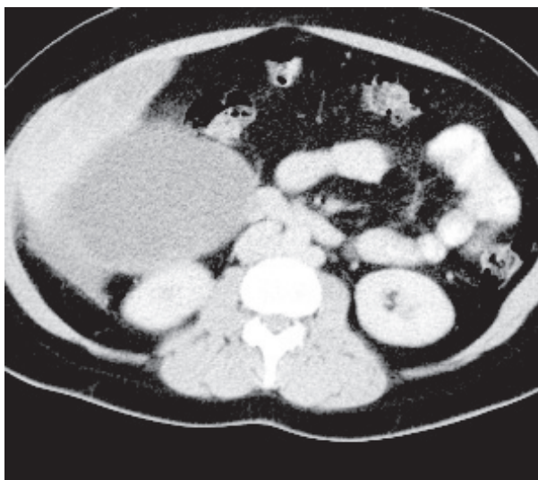
Figura 1. Tomografía axial computarizada. Tumoración quística ubicada por delante del riñón derecho, debajo del hígado, desplazando colon e intestino delgado hacia adelante

"El proceso de referencia se extiende caudalmente hasta fosa ilíaca derecha y en íntimo contacto con el músculo psoas ilíaco ipsilateral".