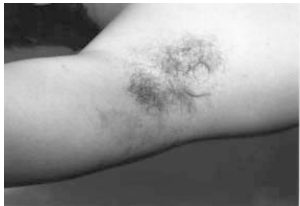
Figura 2. Lesiones en región axilar