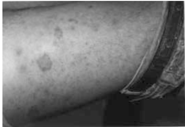
Figura 1. Lesiones eritemato-escamosas de configuración numular en miembro inferior

Las características clínicas de las lesiones se corresponden claramente con las descritas en la literatura y su aparición coincide con su exposición laboral. La sensibilización de contacto a metales suele adoptar una disposición numular –como en el caso de nuestro paciente– y el compromiso de áreas flexurales se explica por el depósito preferencial en esas áreas de las partículas de polvo (3) . Los resultados de la prueba epicutánea de parche confirman una dermatitis de contacto alérgica al cromo (DACC). La prueba epicutánea mostró, además, una sensibilización al cobalto. La persistencia de la DACC una vez cesada la exposición inicial traduce la característica evolución crónica y persistente. La DACC puede permanecer activa diez