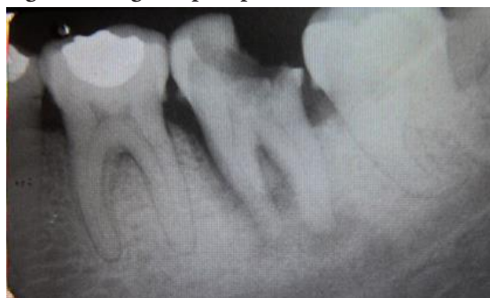
Fig. 1: Radiografía periapical del diente 37

Se observa lesión periapical que afecta ambas raíces e involucramiento de la zona de furca