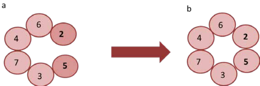
Fig. 3: a- Complejo inactivo b- complejo activo