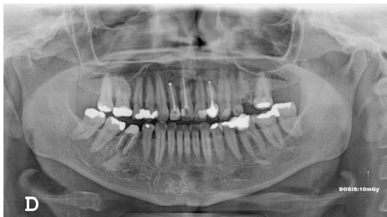
Fig. 1: Radiografía panorámica en la que se observan dientes con tratamiento endodóntico