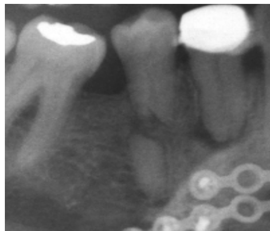
Fig. 3. Toma parcial de una radiografía panorámica con hallazgo de fractura horizontal.

Los otros hallazgos analizados (Fig. 3) se presentaron en muy baja frecuencia. Para ninguno de los casos, se encontraron diferencias estadísticamente significativas entre hombres y mujeres.