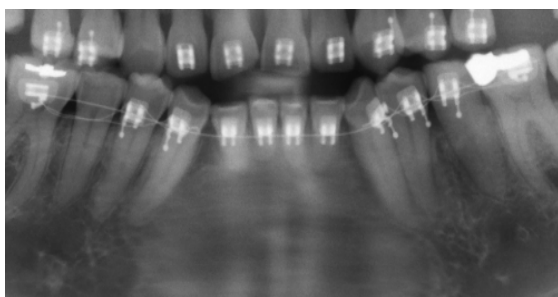
Fig. 2. Toma parcial de una radiografía panorámica en la que se observa dientes con reabsorciones

Los otros hallazgos analizados (Fig. 3) se presentaron en muy baja frecuencia. Para ninguno de los casos, se encontraron diferencias estadísticamente significativas entre hombres y mujeres.