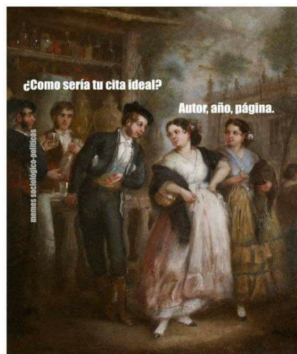
Ilustración 3. Meme bibliotecológico «¿Y tu cita ideal?»