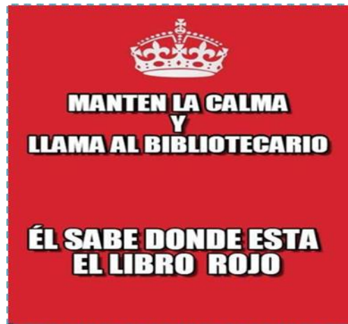
Ilustración 1. Meme bibliotecológico: «Tranquilo...nosotros acá estamos @_@»