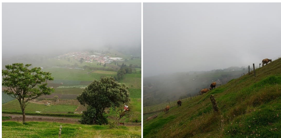
Figura 1: Vistas del territorio de San Gerardo de Oreamuno desde la cima del Cerro Pasquí. Abril de 2022.

En ese terreno, los hermanos Montenegro se dedican a la producción de hortalizas y la ganadería de leche (Figura 1). En el sitio que don Fabio me señaló, la familia había colocado una lona de plástico para impedir el paso directo del agua en la estación lluviosa y de los rayos del sol, durante los períodos secos. Ese espacio es utilizado por los Montenegro como centro de operaciones, el lugar donde reciben las excursiones que transportan a grupos de turistas interesados en visitar el Cerro Pasquí.