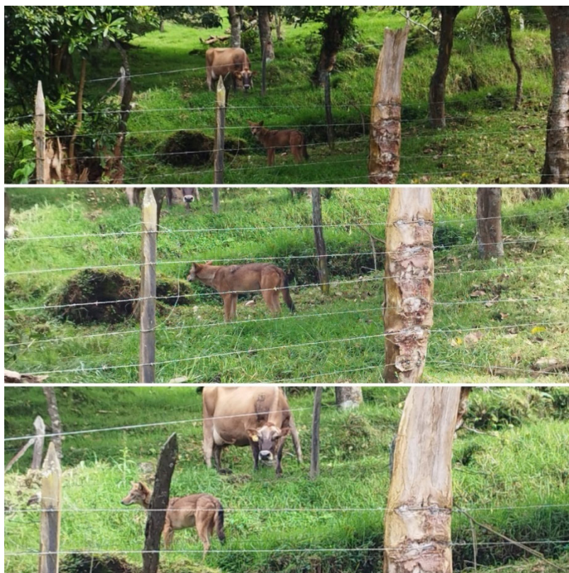
Figura 6: Un encuentro entre una vaca y un coyote en San Gerardo de Oreamuno.

de una situación en la que se produciría un ataque de coyote de un momento para otro. Las imágenes tratan sobre la interacción entre un individuo de esa especie y una vaca, aparentemente preñada. Se puede apreciar que la vaca adopta una posición de creciente incomodidad ante la presencia del coyote. A simple vista, parece que está molesta y busca el modo de mantener a su acosador a una distancia aceptable. Para entonces, el coyote ya ha percibido la presencia humana y parece confundido. Por su parte, la vaca mantiene su mirada puesta en el animal que tiene ante sí; y la posición de su cuerpo –cada vez más tenso– hace presuponer que se prepara para embestir: peso apoyado hacia su frente, cabeza agachada, orejas levantadas, patas delanteras apoyadas con firmeza.