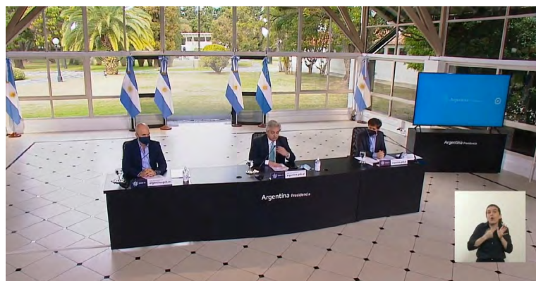
Figura 3. Captura de pantalla del streaming de la conferencia de prensa presidencial emitido por la cuenta de Facebook de Alberto Fernández.

por las lógicas de la salud, así como la disposición del presidente en el medio de todos ellos con las lógicas político/mediáticas (ver la Figura 3).