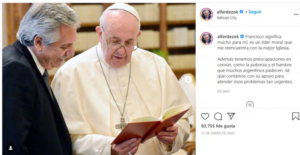
Figura 2. Cuenta de Alberto Fernández en Instagram

el proceso histórico de mediatización de la política en las redes sociales. En la sección siguiente analizaremos las redes sociales del presidente argentino y compararemos el momento prepandemia con el que se está desarrollando durante la pandemia por COVID-19.