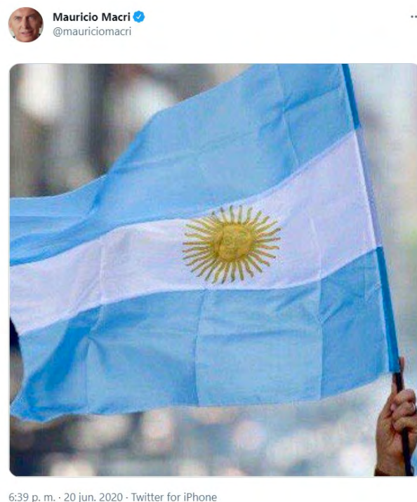
Figura 1. Cuenta de Mauricio Macri en Twitter

En las redes sociales de Macri, en el primer semestre 2020, se evidencia una reducción de los contenidos vinculados a lo privado y también aquellos que apuntaban a las “micro-argumentaciones pasionales” (Slimovich, 2012, p. 151), que habían sido característicos de sus