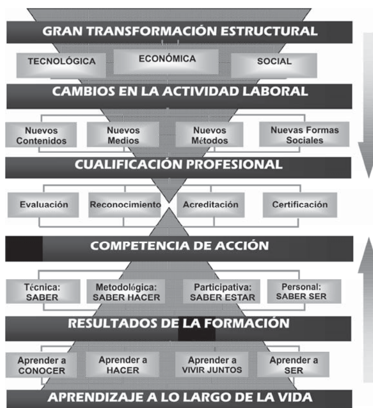
Gráfico 1. Reloj de arenas movedizas (Echeverría, 2008: 27)