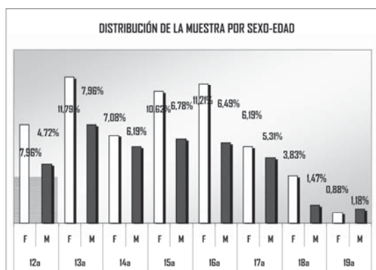
Gráfico 1: Distribución de la población según sexo y edad, con resultados porcentuales

Los procedimientos de análisis descriptivo según sexo y edad muestran la distribución que se muestra en el Gráfico 1. Con un mínimo de 12 años y un máximo de 19, para un 41% de jóvenes de sexo masculino y 59% para femenino.