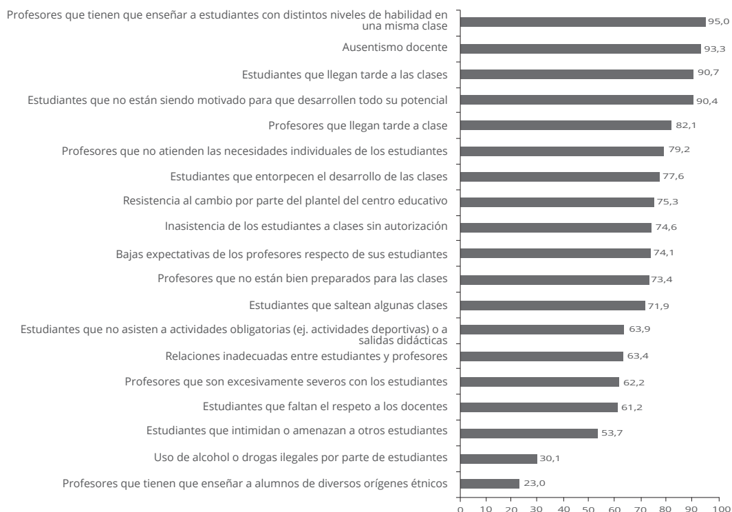
Gráfico 1. Problemas de clima educativo (% de acuerdo desde muy poco, hasta mucho )