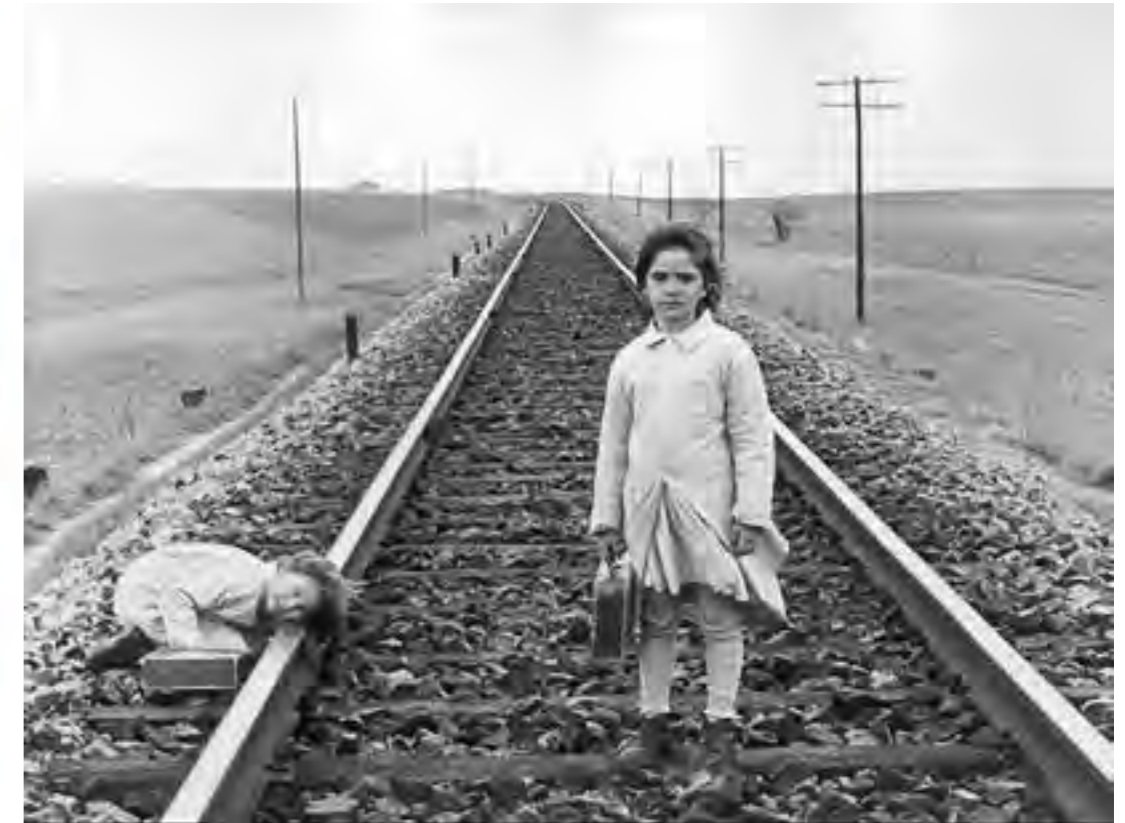
Figura 6. Fotograma del Espíritu de la colmena (1973). Victor Erice