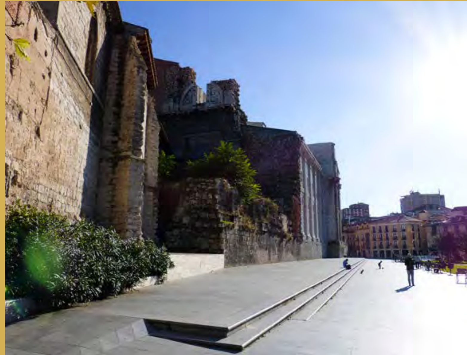
Figura 10. Pasado, presente y futuro. Vista posterior de la Catedral de Valladolid, España.