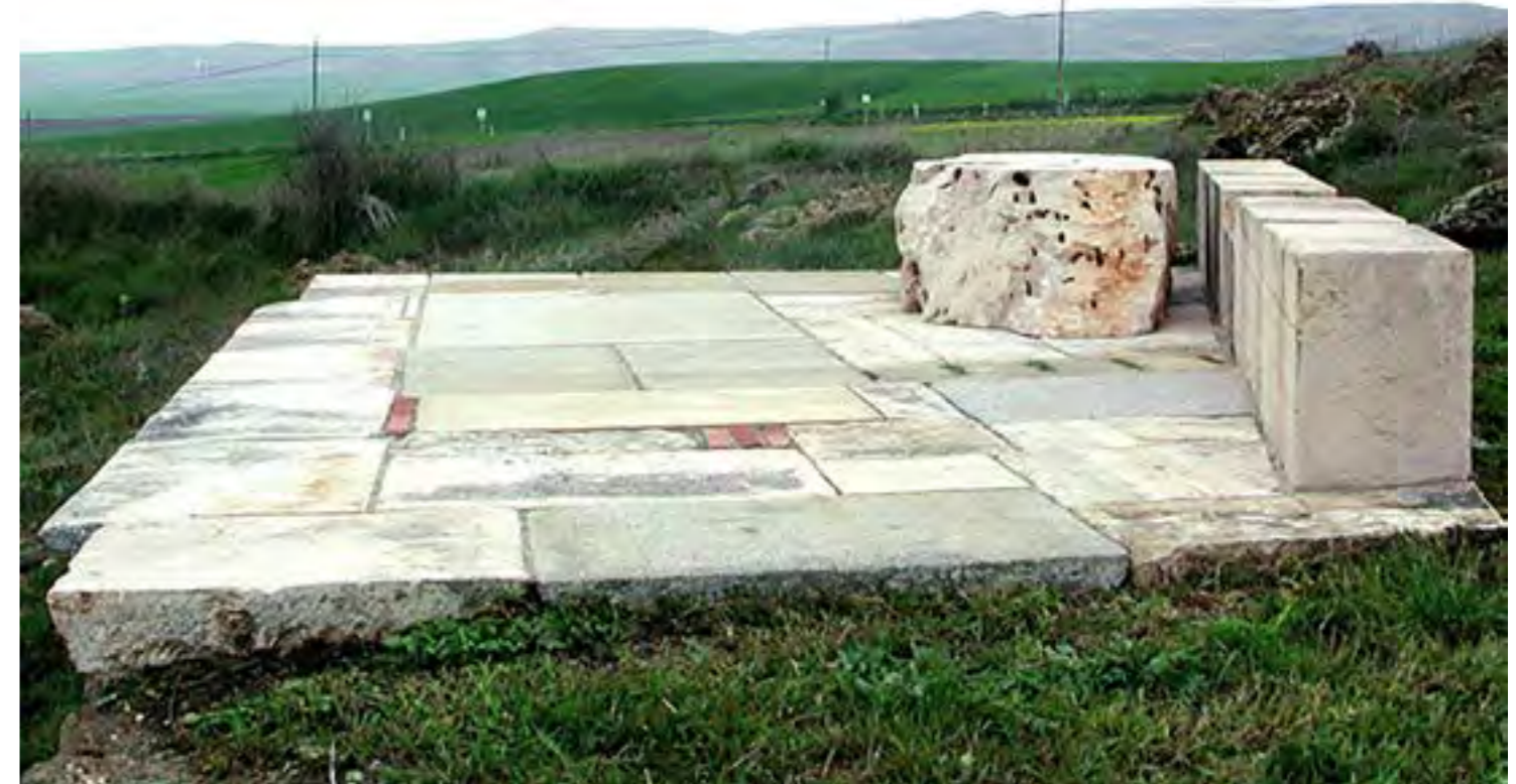
Figura 2. Mirador en Quintanilla Vívar. Camino del Cid.

El paisaje, por lo tanto, se genera a partir de diversos estratos de significado. Como los paisajes que fotografía Tomoko Yoneda, donde detrás de ellos hay una fuerte carga de memoria, aumentados por la dimensión del tiempo. Paisajes cotidianos, que la memoria y el tiempo han redimensionado.