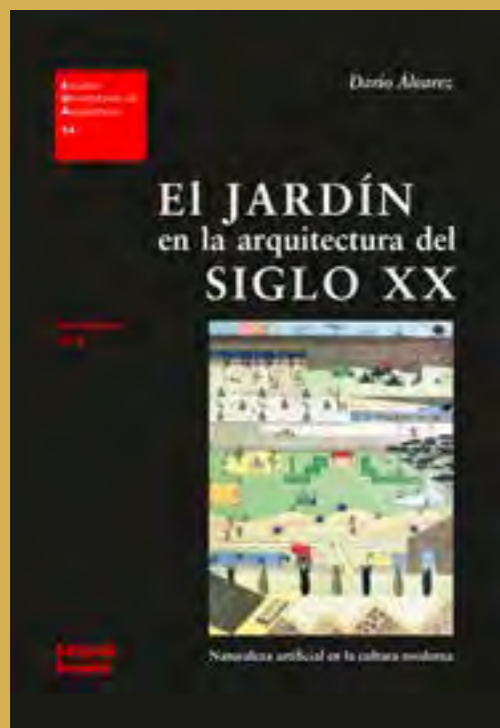
Figura 4. Tapa El jardín en la arquitectura del siglo XX. Dibujo realizado en 1982 por la Office for Metropolitan Architecture (OMA, Rem Koolhaas y Elia Zenghelis) para el concurso del Parc de la Villette en París. Se muestra una secuencia de jardines en estratos horizontales mostrando un espacio de fragmento y unicidad.

que se van uniendo aglomerados por el paisaje. El paisaje arquitectónico incluye al concepto de jardín, a distintas escalas, y hay una intencionalidad, un proyecto. El paisaje patrimonial es el paisaje que ha quedado proyectado y la capacidad que tenemos de recuperarlo, transformarlo y actualizarlo. Procuero separar estos campos y no hablar de paisaje en general. Mi grupo de investigación, de hecho, se llama “Laboratorio de paisaje arquitectónico patrimonial y cultural”.