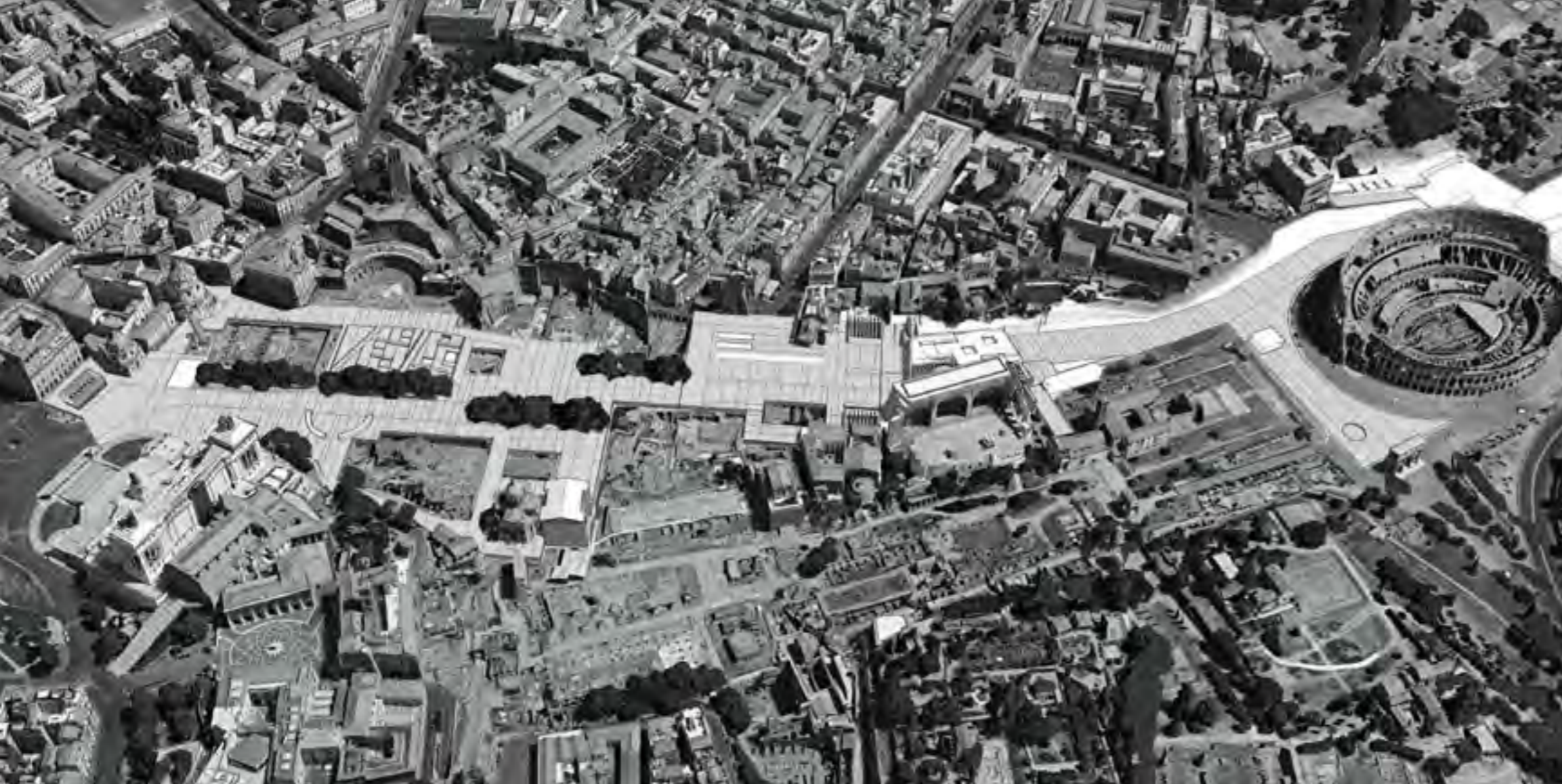
Figura 7. Concurso para la Vía de los Foros Imperiales. Proyecto de LAB/PAP, planta y volumetría general.

el trazado más conocido, el camino francés, sino uno que viene del sur, de Andalucía. Esa parte del camino lo único que hizo fue superponerse a la antigua calzada romana. En el Camino de Santiago, así como en muchos itinerarios culturales, es muy usual encontrar marcas, señales que dejan los peregrinos, flechas, indicaciones. Nosotros planteábamos que, en ciertos lugares, sugerir que los viajeros dejaran en la calzada romana, piedras, marcas, señales, objetos; construyendo la propia memoria del paisaje. Se temió que fuese una invitación al vandalismo por lo que no lo pudimos poner en práctica, pero hubiese sido una experiencia de cómo en un paisaje muy asentado, con una serie de estratos desde la calzada romana, las vías de peregrinación medievales, las cañadas de trashumancia de ganado, los caminos reales del siglo XVIII, de repente en el siglo XXI todavía siguen vivos y pueden admitir memorias de los habitantes actuales.