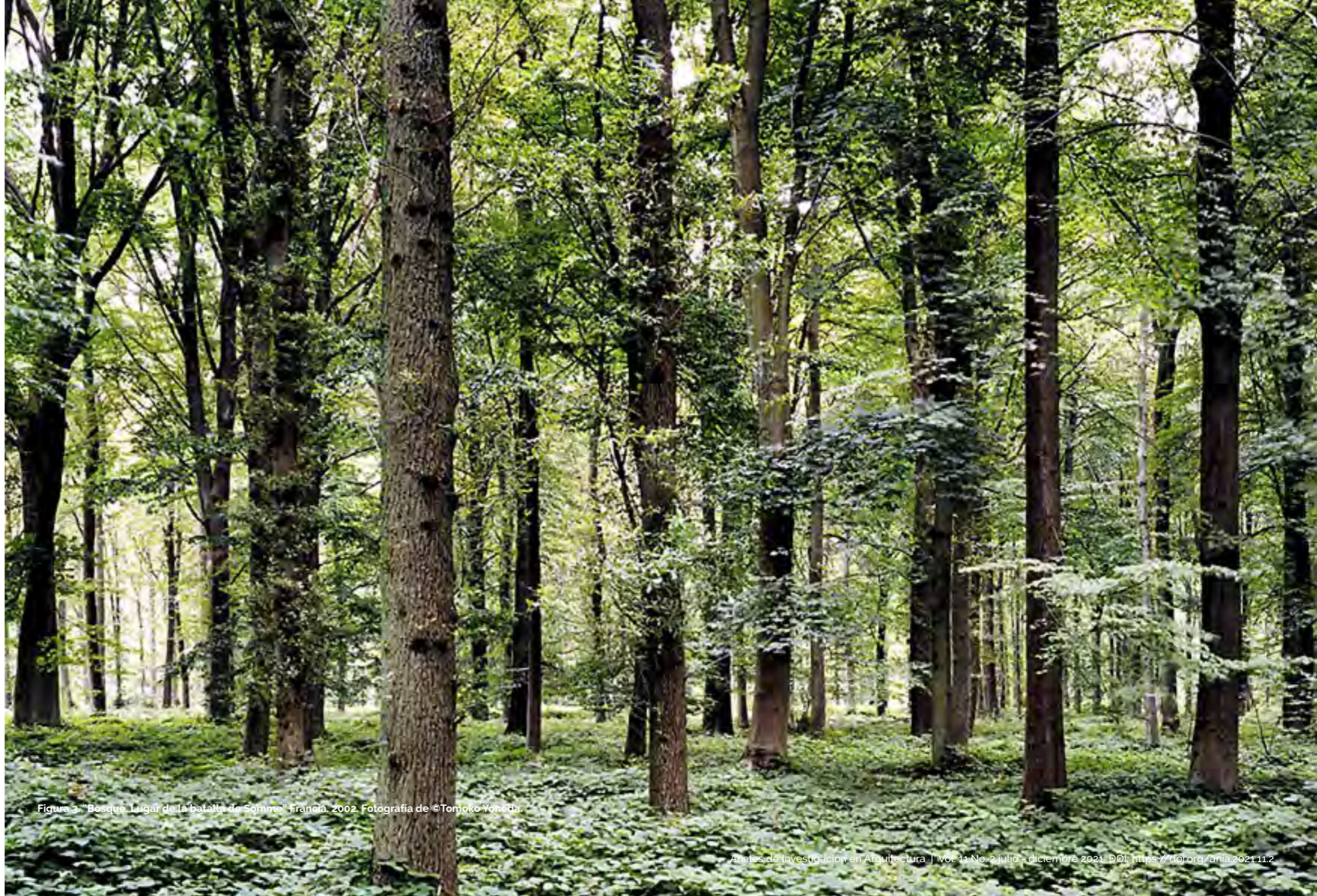
Figura 3. "Bosque Lugar de la batalla de Somme" Francia, 2002.