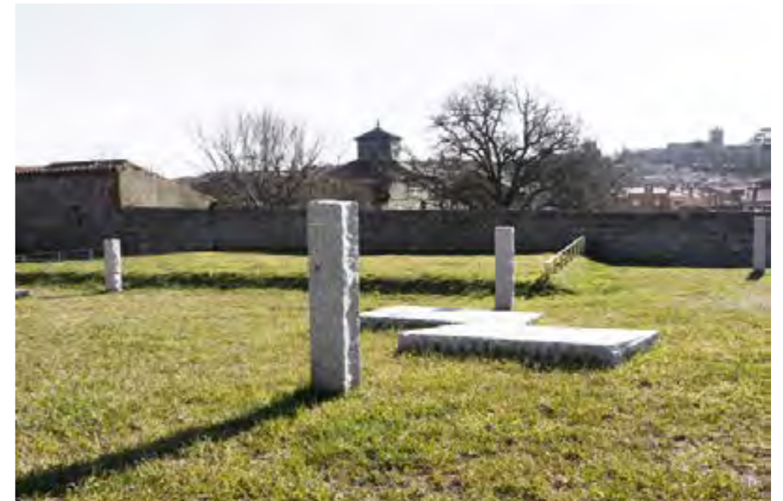
Figura 9. Jardín de Sefarad. Ávila. Vista general con la ciudad al fondo.