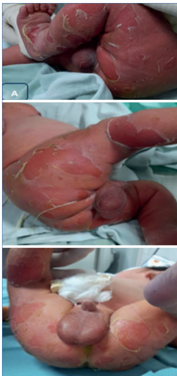
Figura 1-A. Dermatitis diseminada erosiva, máximo lesional en áreas de fricción.

ras con hemocultivo sin desarrollo. Exudado cutáneo desarrolla Staphylococcus aureus , recibe tratamiento tópico con buena evolución (Figura 1-B).