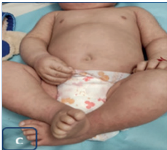
Figura 1-C. Siete meses. Hiperqueratosis en codos y rodillas.