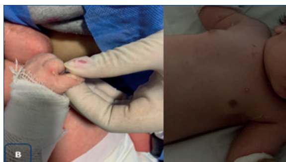
Figura 1-B. Nivel interdigital en mano derecha, tórax y muslo izquierdo, lesiones pustulosas con halo eritematoso (producidas por Staphylococcus aureus ).

El paciente fue dado de alta a los 20 días de vida, continuando en seguimiento en policlínica de derma-