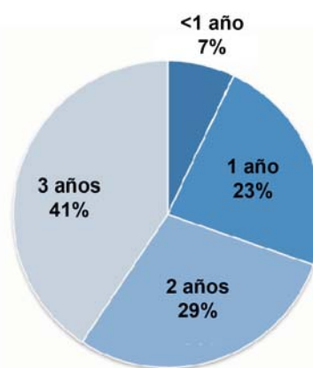
Figura 1. Distribución por grupos etarios.

como la velocidad de eritrosedimentación, proteína C reactiva y lactoferrina (11,12) .