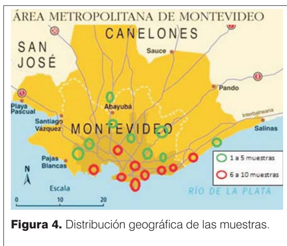
Figura 4. Distribución geográfica de las muestras.

(OMS): crecimiento que se ha manteniendo entre percentiles 3 y 9, sin cruzar carriles de percentilos.