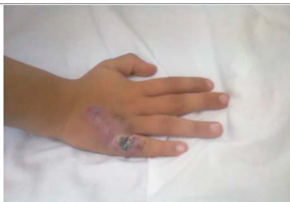
Figuras 1 y 2. Lesión verrucosa, ulcerada de bordes eritematosos con escasa secreción serosa por múltiples poros