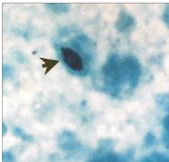
Figura 4. Examen microscópico, levadura en forma de "habano" con la coloración de Gomori.

te en cara y cuello siendo más frecuente la forma cutánea fija (15,17,18) .