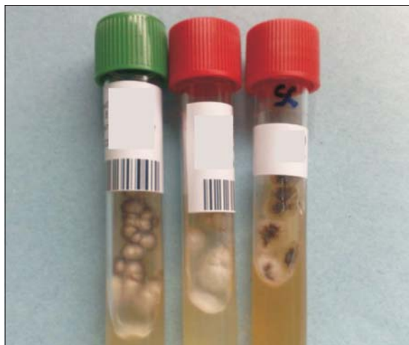
Figura 5. Aislamiento de Sporothrix sp de lesión de mano.

Las lesiones descritas con el chancro de inoculación y la linfangitis regional son un ejemplo de complejo cutáneo primario, o síndrome chancriforme de Wilson,