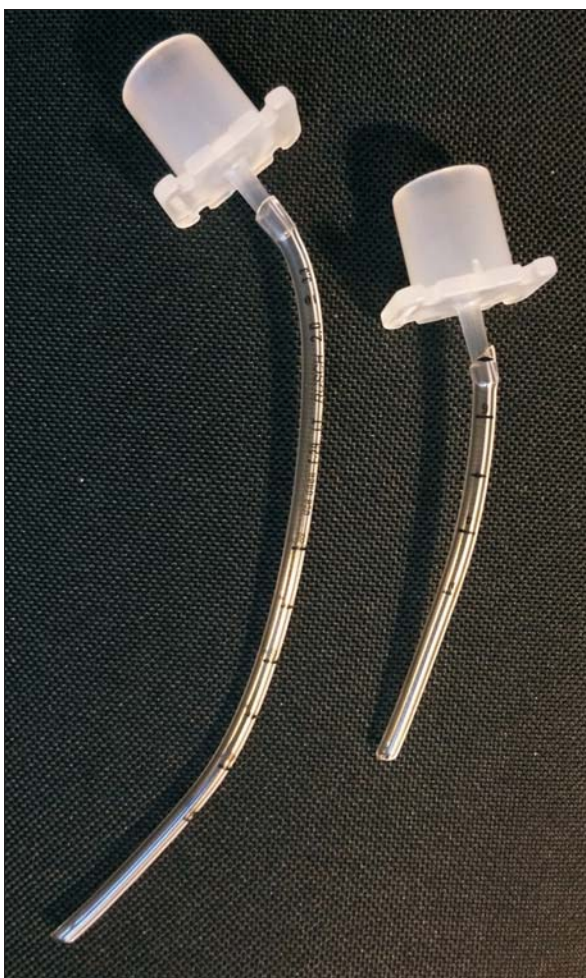
Figura 2. 1) Sonda endotraqueal convencional calibre 2 (a izquierda). 2) Sonda calibre 2, recortada a 7 cm para introducción hasta 4 cm en orificio externo nasal (a derecha)

lizó IOT y administró segunda dosis de surfactante. Se extubó a nCPAP a las 17 horas de vida sin complicaciones.