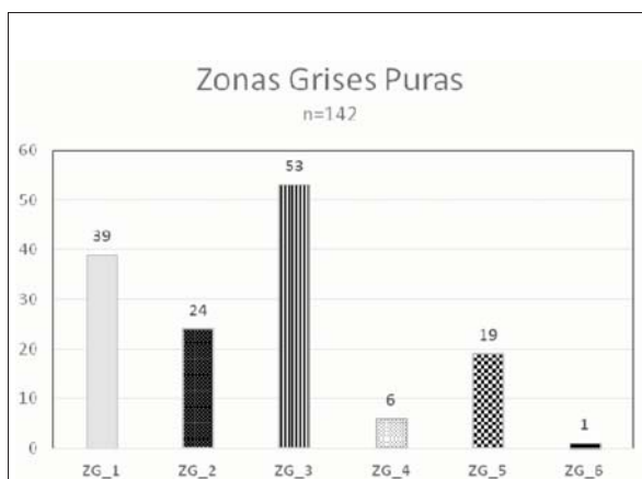
Figura 2. Zonas Grises Puras. ZG1: 39 casos. Casos con información incompleta. ZG2: 24 casos. Se detectó un factor de riesgo al dormir, aunque este es poco probable que haya causado la muerte. ZG3: 53 casos. Se detectó un factor de riesgo al dormir que pudo ser causante de la muerte. ZG4: 6 casos. Se obtuvieron cultivos positivos, sin alteraciones morfológicas en la autopsia. ZG5: 19 casos. Se encontraron alteraciones morfológicas en la autopsia, pero que no explican la muerte. ZG6: 1 caso. Se detectó una alteración con posibilidad de dar arritmia.

En esta publicación se vuelven a analizar los 115 casos de la publicación anterior (1) y se le aplican los criterios de la actual clasificación. En la publicación anterior no se consideraron las condiciones del sueño y un elevado porcentaje de los casos no tenía entrevista.