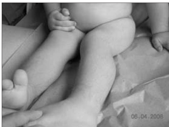
Figura 3. Hirsutismo como efecto adverso del diazóxido