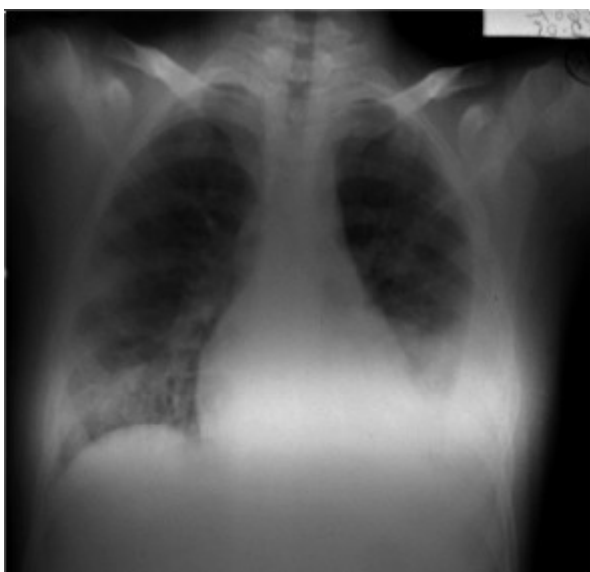
Figura 1. Estudio radiológico de tórax de frente.

Ecocardiograma: a nivel de valva septal de tricúspide imagen sobre cara auricular de 1,26 cm de diámetro mayor y 0,7 cm de diámetro menor; con 0,86 cm 2 de área, móvil, compatible con vegetación endocárdica que genera insuficiencia valvular leve (figura 2). Con diagnóstico de EI sobre válvula tricúspide complicada con derrame pleural secundario a embolia pulmonar séptica se inicia triple plan antibiótico con vancomicina + amikacina + penicilina, hasta el día 3 cuando se obtienen los resultados de los hemocultivos seriados (uno cada 24 h): Staphylococcus aureus meticilino sensible en tres muestras. Posteriormente se ajusta antibioticoterapia según sensibilidad iniciando cefuroxime 150 mg/kg/día. A los 10 días de